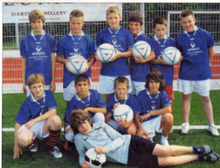
Die E-Jugend des TuS Stetten wurde ungeschlagen Staffelsieger.