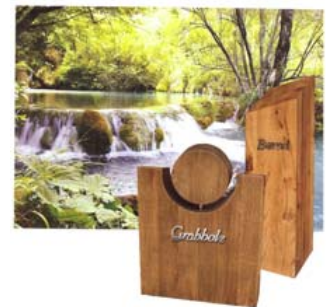
Grabmale aus Holz – ein Werkstoff der Natur

Weitere Informationen erhalten sie über: